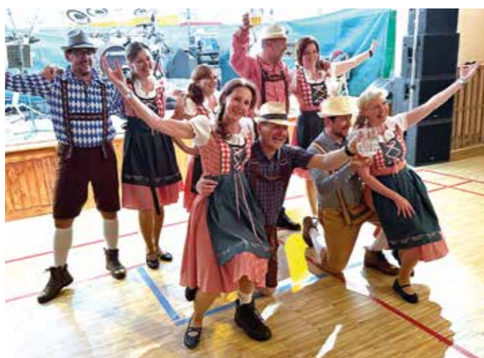
Ples sportovců se nesl v duchu Oktoberfestu.

O VÍKENDU 14. A 15. 3. 2026 SE V LIBČICKÉ SOKOLOVNĚ USKUTEČNIL JIŽ ČTVRTÝ ROČNÍK OBLÍBENÉHO PLESU SPORTOVČŮ, NA KTERÝ V NEDĚLI NAVÁZAL VESELÝ DĚTSKÝ KARNEVAL. OBĚ AKCE POŘÁDANÉ POD TAKTOVKOU AFK LIBČICE A SOKOLA LIBČICE OPĚT POTVRDILY, ŽE ZÁJEM O SPOLEČENSKÉ DĚNÍ V NAŠEM MĚSTĚ JE OBROVSKÝ.