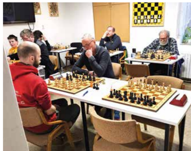
Momentka z domácího zápasu A teamu proti velvarskému Áčku

Během březnových dní začala sezona Libčických šachistů psát svojí předposlední kapitolu a pozice obou týmů se vyjasňuje. B team ve dvou po sobě jdoucích zápasech deklasoval svého soupeře z Buštěhradu, když Áčku nadělil dokonce „bůra“. Před posledním kolem je tak jasné, že hůř než druhé místo v celkové výsledkové tabulce už neunikne, což je výsledek nad očekáváním. A tým naopak nenavázal na zlepšené výsledky a doma podlehl těsným