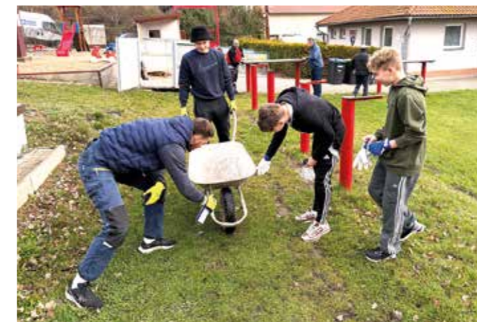
Do práce se zapojili i fotbalisté AFK.