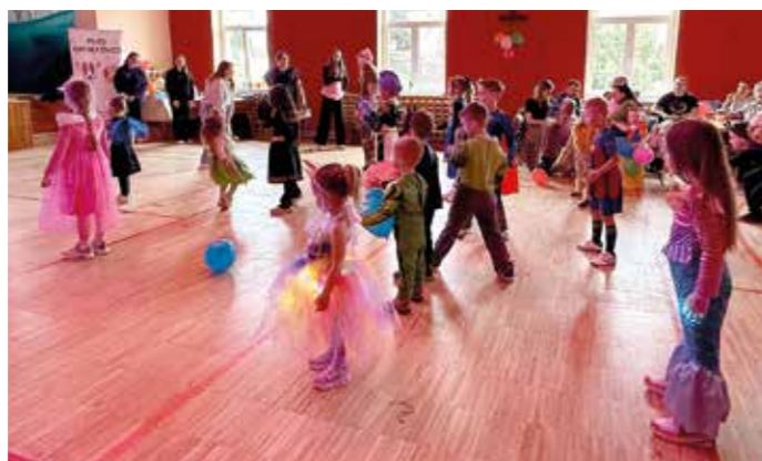
Děti přišly na karneval v krásných maskách.