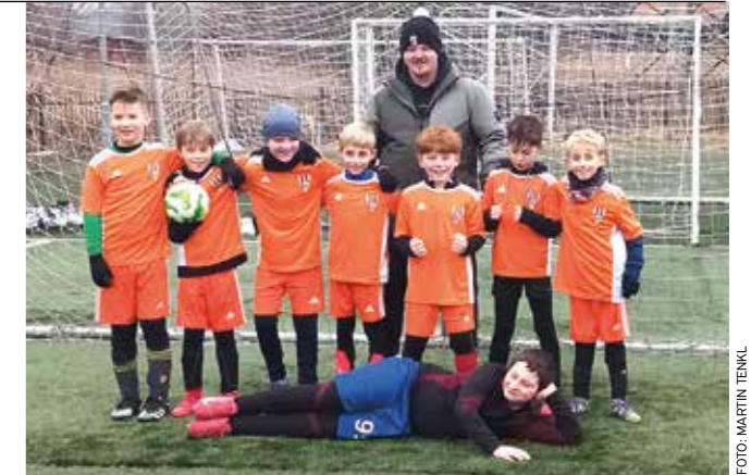
Fotbalisté Libčic přes zimu nezháleli.