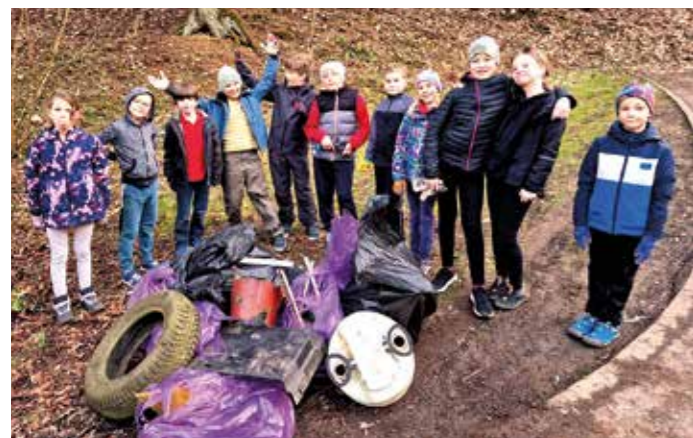
Skautský oddíl Osmička