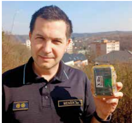
Přístroj CzechRad na měření gamma radiace v rukou libčických hasičů

Ten vychází z originálního zařízení Safecast bGeigie Nano a je součástí globální sítě měření radiace Safecast. CzechRad je vylepšená verze původního zařízení, navržená českými vědci s cílem snížit co nejvíce závislost na importovaných součástkách. Jedná se o Geiger-Müllerův detektor fungující na principu ionizace plynu při průletu částice. Přístroj obsahuje i GPS, baterii a potřebnou obslužnou elektroniku včetně malé obrazovky, která udává naměřené hodnoty dávkového příkonu v mikrosievertch za hodinu.