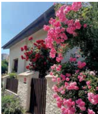
Předzahrádky v Zahradní ulici

Nenechte se zahanbit a přidejte se do soutěže o nejkrásnější květinovou výzdobu! Předzahrádka, záhonek či okenní parapet musí být dobře viditelný z ulice, to je jediná soutěžní podmínka. Fotografie vaší květinové chlouby nám pošlete do konce října na e-mail podatelna@libcice.cz nebo datovou schránkou. ■