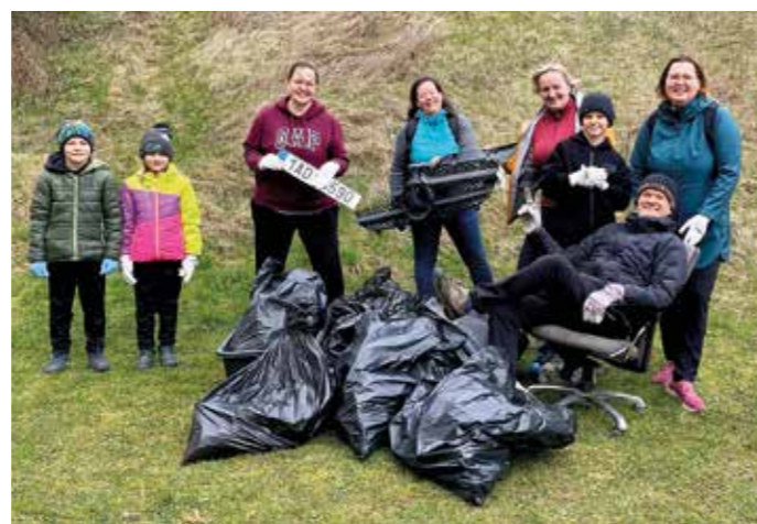
Dobrovolníci na Sahaře