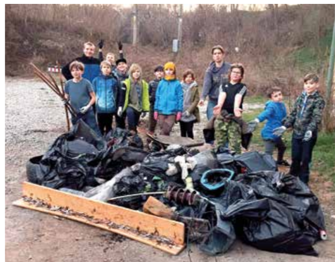
Přátelé přírody – Upírci