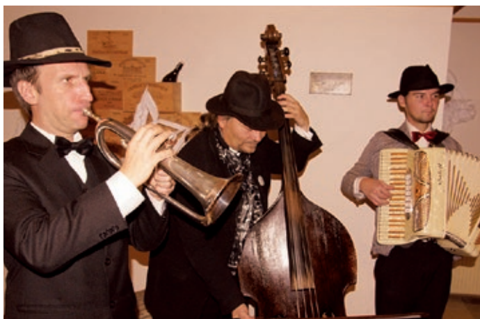
Pražský pouťový orchestr na Vánočních dílnách.