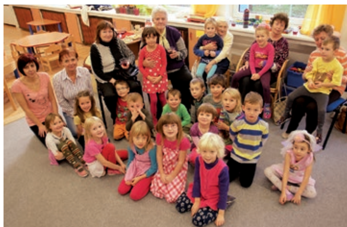
Vánoční setkání MŠ a Klubu seniorů.