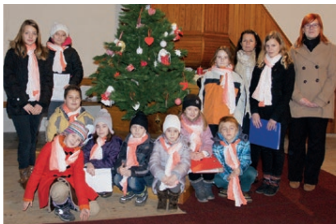
Vánoční koncert Shalomu v evangelickém kostele.