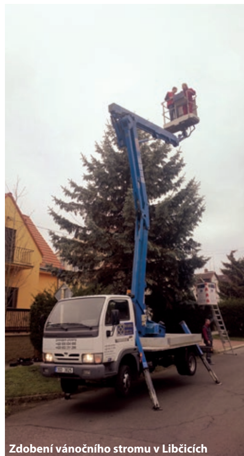
Zdobení vánočního stromu v Libčicích