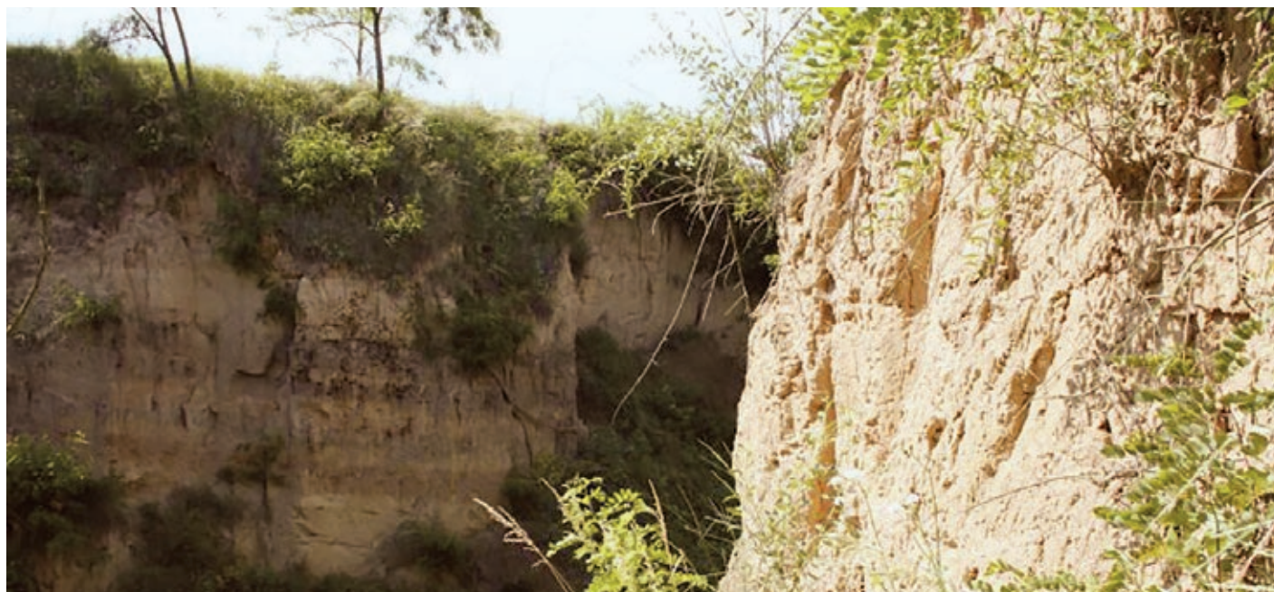
Strž u Zeměch.