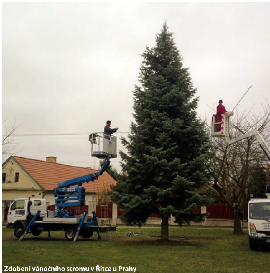
Zdobení vánočního stromu v Řitce u Prahy