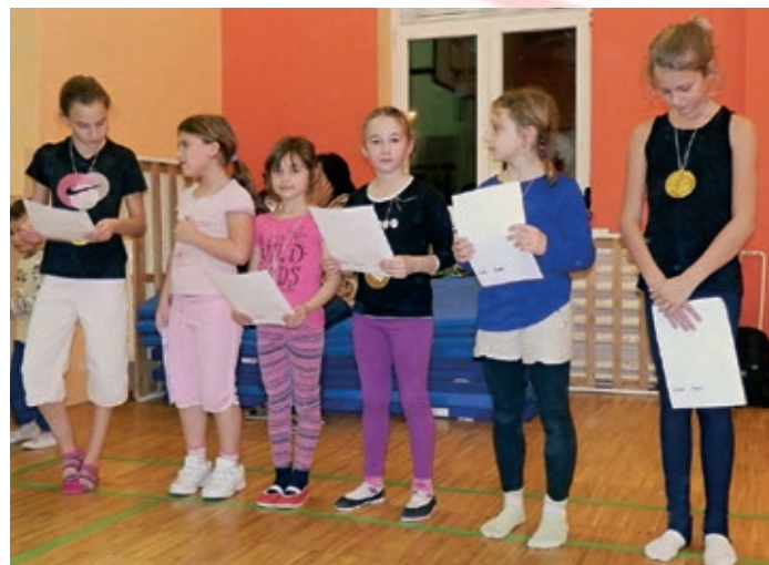
Čestné uznání si zasloužil každý, kdo se zúčastnil.