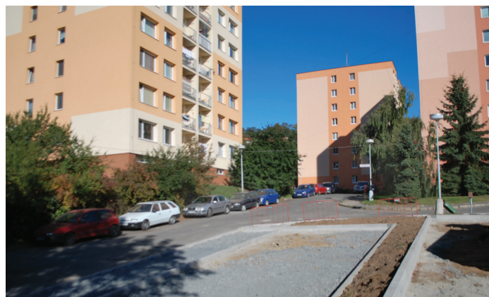
Revitalizace sídliště Nová Sahara