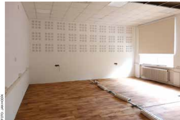
V počítačové učebně byly instalovány klimatizační jednotky, zadní akustická stěna a podhledy, výmalba stěn.