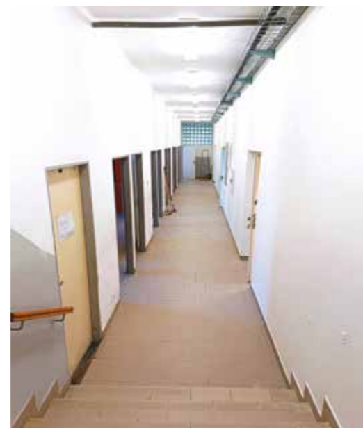
Na chodbě byla odstraněna předstěna, zřízeny nové rozvody vody a elektřiny. Elektřina je nově vedena ve žlabu u stropu, kde se plánuje instalace podhledů.