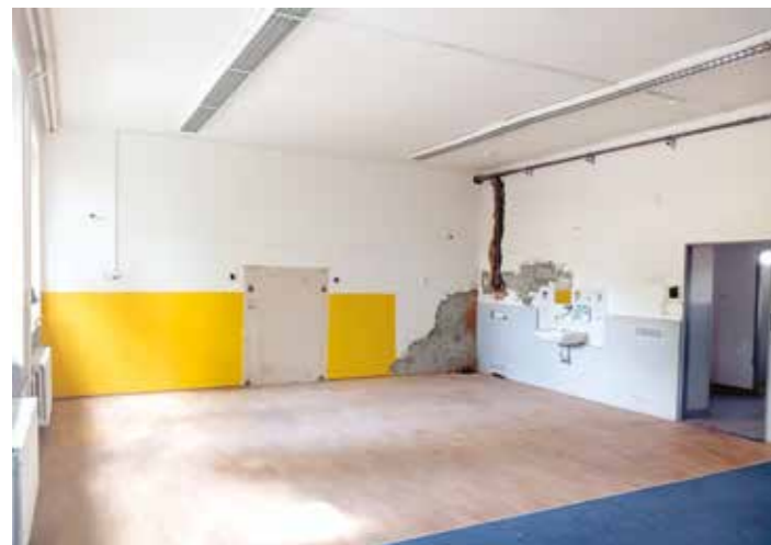
V učebně trpící vlhkostí byla zdemontována předstěna u umyvadla, která sloužila k zakrytí důsledků vlhkosti (mokrý stěny, plíseň), prostor byl zasanován, proběhla výmalba, úprava podlahového podloží.