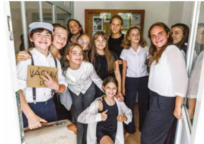
Tanečnice a hudebníci ZUŠ vystupovali společně.

TŘETÍ TÝDEN PRÁZDIN V ZUŠ PROBÍHALY LETNÍ KURZY – POPRVÉ SPOLEČNĚ PRO TANEČNICE A HUDEBNÍKY. MY TANEČNICE JSME SPOLU S KYTARISTY STRÁVILY TÝDEN OBJEVOVÁNÍM ZÁKOUTÍ A MINULOSTI ZUŠ, IMPROVIZACÍ A VLASTNÍ TVORBOU. DÍKY LIDEM, KTEŘÍ V ZUŠ DŘÍVE BYDLELI, JSME MOHLI NAŠI ŠKOLU VIDĚT V ÚPLNĚ NOVÉM SVĚTLE.