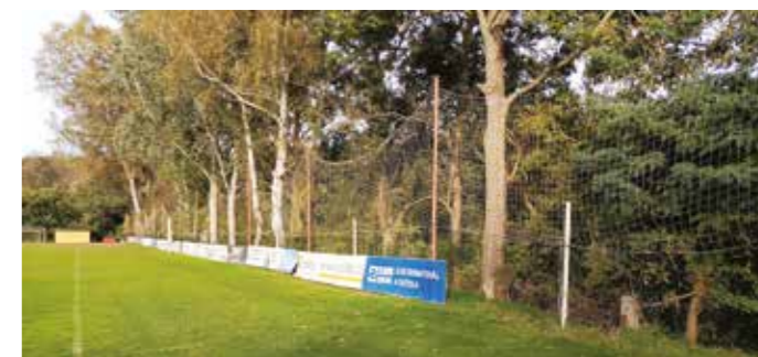
Nové oplocení kolem fotbalového hřiště

startovací jámu pro zahájení protlaku potrubí pod silnicí. Jejich pochopení velmi pomáhá.