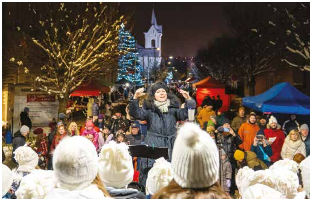
Tradiční vánoční písně v podání dětského pěveckého sboru Škatulata zaznějí i letos.

MARKÉTA: Letos opět spojíme jarmark s vánočním trhem základní školy a koncertem v evangelickém kostele, ale bude i pár novinek. Jarmark se rozprostře v ulici 5. května, kde postavíme pódium pro vystoupení dětí. Celou ulici olemují stánky s výrobky, knihami, najdete také množství stánků s teplými pokrmy i nápoji. Nakoupíte vánoční výzdobu, věnce, jmelí i dárky pro potěšení. Trh zahájíme ve 13 hodin. Těší nás, že své provozovny s vánočním sortimentem na adventní neděli otevřou i naši místní