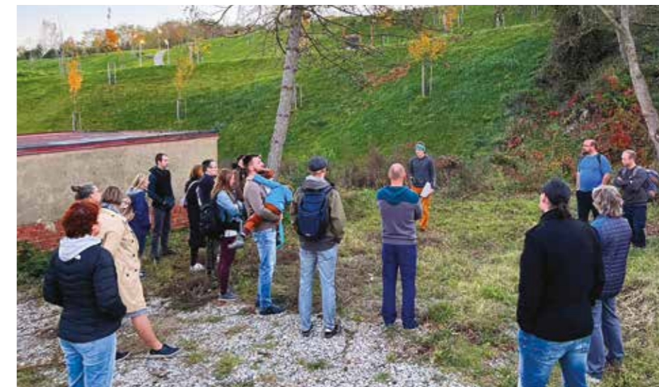
Diskuze v místě plánované realizace asfaltové pumptrackové dráhy.

Vytipovali jsme a prověřili několik lokalit a nakonec vybrali jako optimální tu, o níž se domníváme, že je dobře dostupná, není přímo u silnice ani mimo