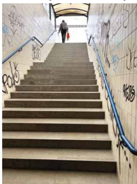
Popraskaná a zničená dlažba na schodištích byla nahrazena, nové jsou i oba výtahy.

Nebylo to jednoduché období. Do jara jsme ještě museli vydržet rozbité schody, později zas výtahy vyřazené z provozu komplikovaly cestování lidem s omezenou hybností nebo cestujícím doprovázejícím malé děti. Děkuji