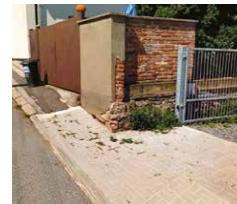
Stav chodníku ve Hřbitovní ulici před a po realizaci

U chodníku byly vyměněny obruby, položen nový asfaltový povrch a na výjezdech z obytných částí položena nová zámková dlažba, protože zde asfaltování nebylo technologicky možné. A jak již bylo zmíněno, určitě by tomuto chodníku slušela větší šířka a lepší příčný sklon. Pro dosažení komfortní schůdnosti jsme se společně se zhotovitelem snažili najít nejvhodnější tvarování profilu chodníku. Omezení daná dvěma poměrně širokými vjezdy umístěnými v těsné blízkosti vedle sebe však mnoho prostoru pro řešení nenabízela, pokud