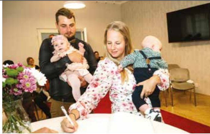
Slavnostní obřad vítání občánků 12. října 2024 na městském úřadě