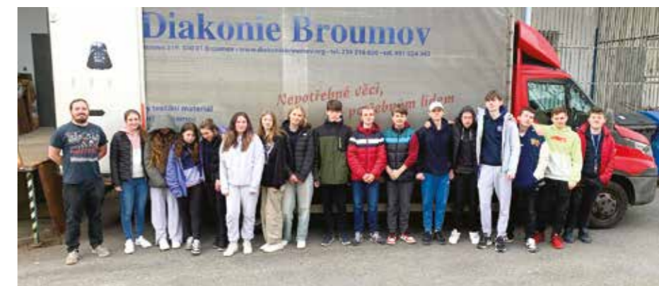
S nakládáním šatstva a dalších věcí pomáhají žáci libčické ZŠ.

Tým kolem Šatničky spolu s dalšími dobrovolníky za sebou má další úspěšnou sbírku pro Diakonii Broumov. Ve středu 23. října 2024 se před Libčickou Šatničkou sešlo neuvěřitelné množství věcí, které dostaly šanci udělat radost někomu dalšímu. Část byla určena pouze pro sbírku a část pro doplnění zimních zásob v Šatničce.