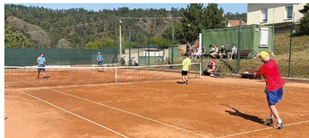
Eso z podání Vláďa Přibáňe ve finále Posvícenského poháru