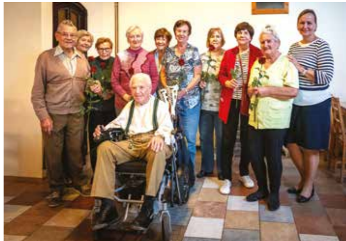
Setkání libčických jubilantů 15. října na plovárně