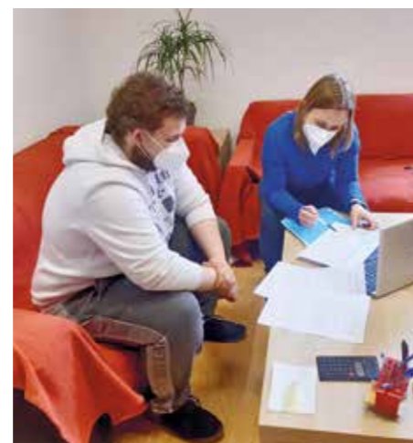
Dluhové poradenství bude poskytováno jednou za dva týdny na Faře Libčice, vždy v úterý od 11 do 16 hodin.