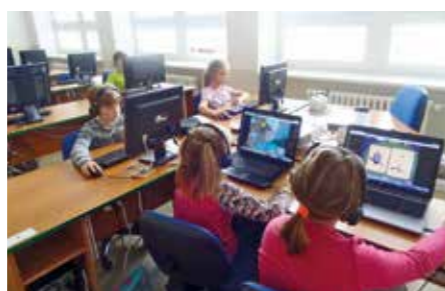
Děti ze Základní školy Bory program SciLearn English vřele doporučují.

do škol i domů. Dle ověření výzkumem i praxí v některých českých školách postoupilo 73 % žáků o celou jednu úroveň společného evropského referenčního rámce pro jazyky za jeden školní rok. Což se očekává za tři až čtyři roky při běžné výuce. Program byl zkoumán i na světově známých univerzitách a je hodnocený jako jednička na rozvoj anglických dovedností institucí ministerstva školství USA. Je rozšířen v 51 zemích světa a využívají ho přes tři miliony studentů.