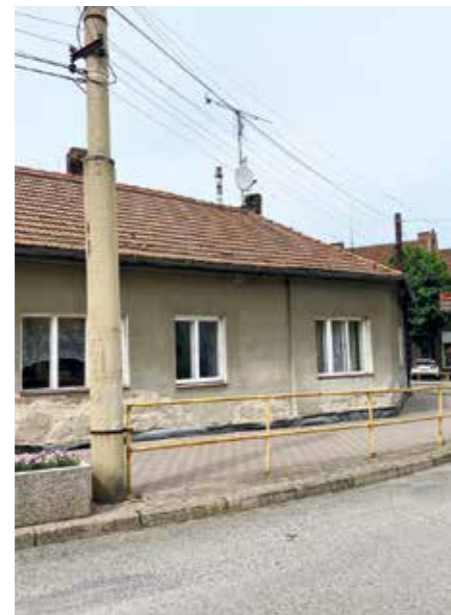
Město spolku Centrum Malina nabídlo k dočasnému užívání domek na náměstí.

Dohoda byla téměř na spadnutí. MC Malina využila prostory pro skladování věcí, které vystěhovala z kulturáku. Zástupkyně Maliny se domluvily s tajemníkem panem Dědičem na adaptačních úpravách v objektu, které byly obratem objednané a zahájeny, tak aby mohly být prostory Malině připraveny co nejdříve. Pár dní na to se vedení MC Malina rozhodlo odmítnout tuto nabídku města, a dokonce obvinilo vedení města z plýtvání prostředků z rozpočtu města. Pro mě je toto jednání nepochopitelné. Město se v rámci jednání o provozu domu nabídlo, že nad rámec již získaných dotací od města pokryje Malině třetinu výdajů na energie, tj. 16 tis. Kč pro letošní rok. Tato nabídka i další nabídka možnosti převedení využití obdržené dotace na provoz domu byla ze strany Maliny odmítnuta a městu bylo oznámeno, že o dům nemají zájem a že zvažují