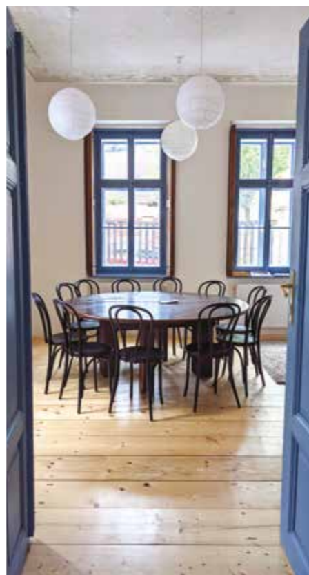
Program komunitního centra Fara Libčice najdete na webu libcice.evangelnet.cz