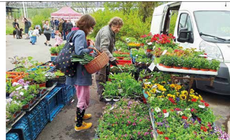
Z široké nabídky farmářských produktů i sazenic můžete vybírat 12. a 26. června.

Váš trvalý zájem a přízeň nám dělá radost a motivuje nás ke zlepšování. Rozšířili jsme nabídku, podařilo se dohodnout nové prodejce a prostor u vily budeme dále zútulňovat, abyste se zde cítili příjemně jako u přátel. Domů si z našeho trhu opět odnesete nejen plný koš čerstvých potravin, ale stejně jako