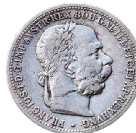
Rakouská stříbrná koruna s portrétem císaře. Vydána v roce 1901.