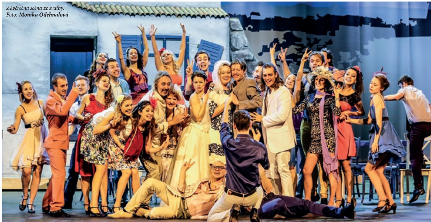
Závěrečná scéna ze svatby.