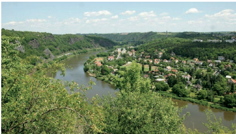
Pohled do údolí Vltavy ze skály v Úholičkách.