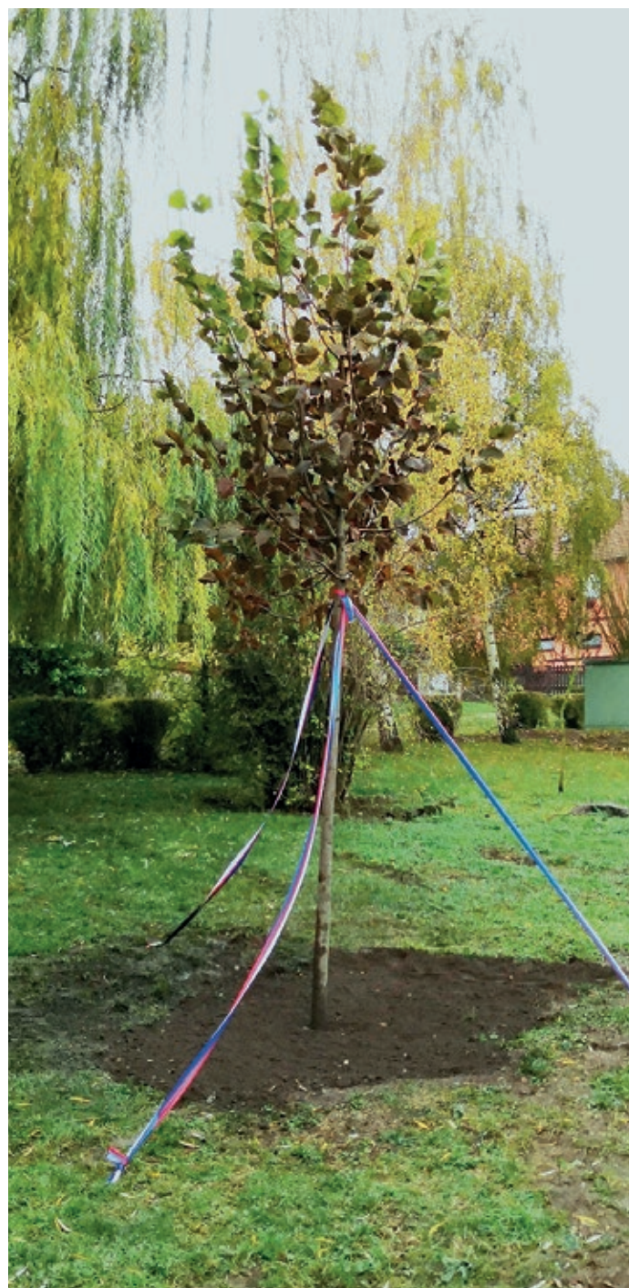
Libčičká Lípa republiky zasazená v den výročí 100 let Československa na náměstí Svobody.

Všem zvoleným blahopřejeme a přejeme jim hodně rozumu a uvážlivosti v řízení města.