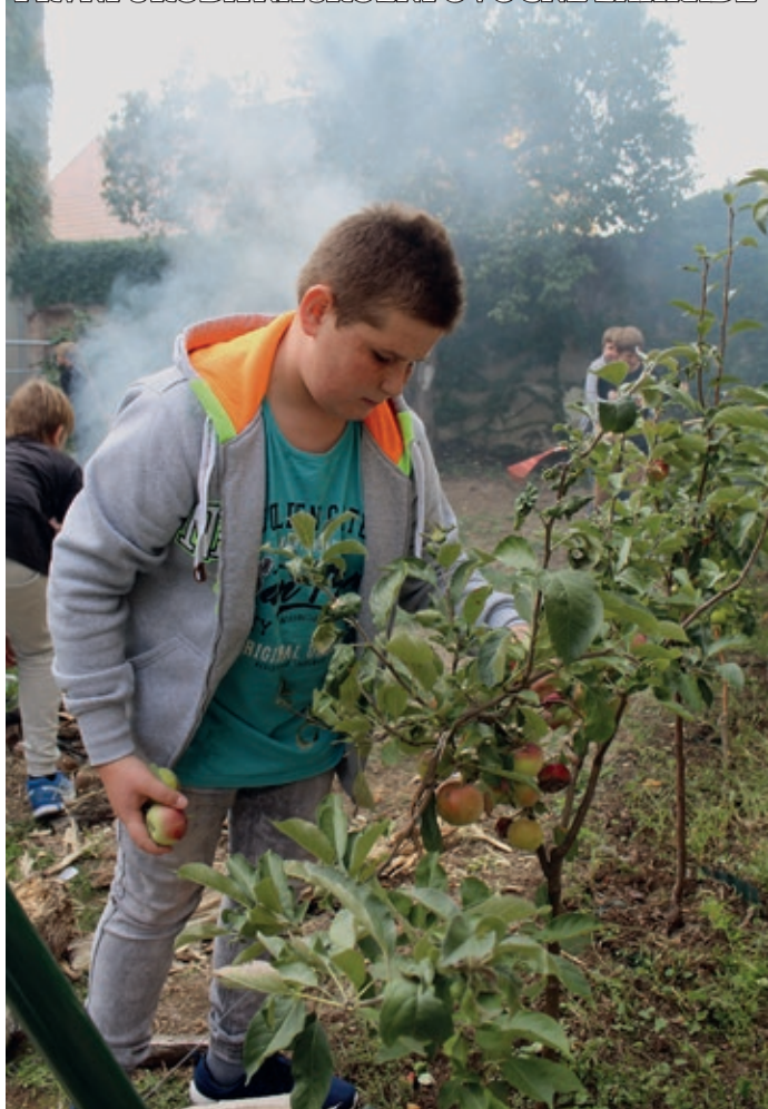
Při hodině pracovních činností si chlapci na 2. stupni užili sklizeň první letošní úrody jablek na naší ovocné zahradě.