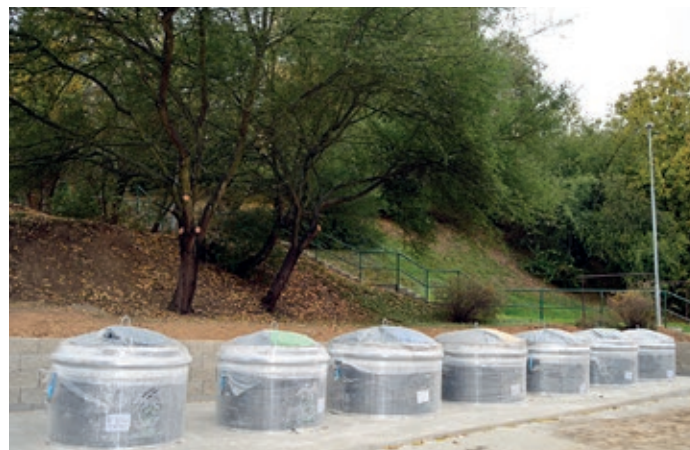
Stará Sahara - nyní.

Na základě četných dotazů občanů podávám následující informace a vysvětlení k instalaci kontejnerů ve městě.