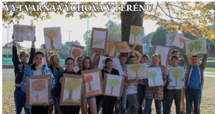
Při výtvarné výchově na 2. stupni rádi využíváme krásného babího léta k výuce v přírodě. 7. třída si užila kresbu podzimního stromu.

Vážení rodiče, milé děti a přátelé školy, ZŠ Libčice nad Vltavou vás zve na tradiční