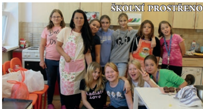
V tomto školním roce si dívky 7. a 6. třídy vyzkoušely v hodině Pě své kuchařské umění ve školní soutěži „Prostřeno“. Porota složená z učitelů hodnotila nejen gastronomickou úroveň pokrmů, ale také kulturu a nápaditost stolování.