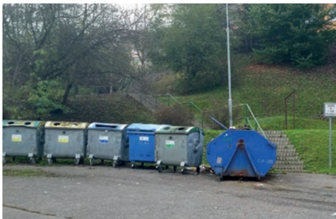
Stará Sahara - předtím.