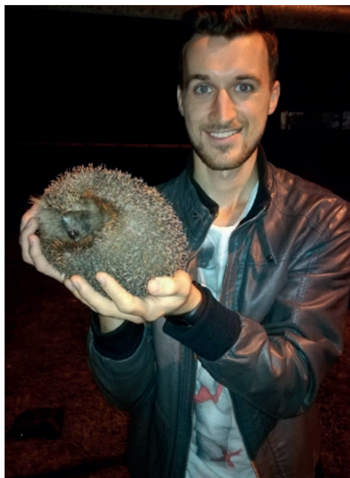
JEŽEK, KTERÝ NA PODZIM NEPOTŘEBUJE POMOC :)