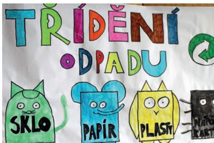
Takto by si představovaly kontejnery děti naší ZŠ.

ČERVENÉ KONTEJNERY 30. listopadu 2018 Poslední svoz.