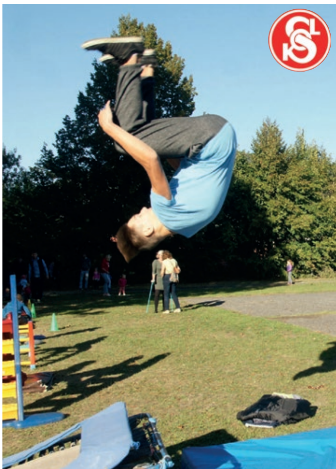
Parkour se těší velkému zájmu.