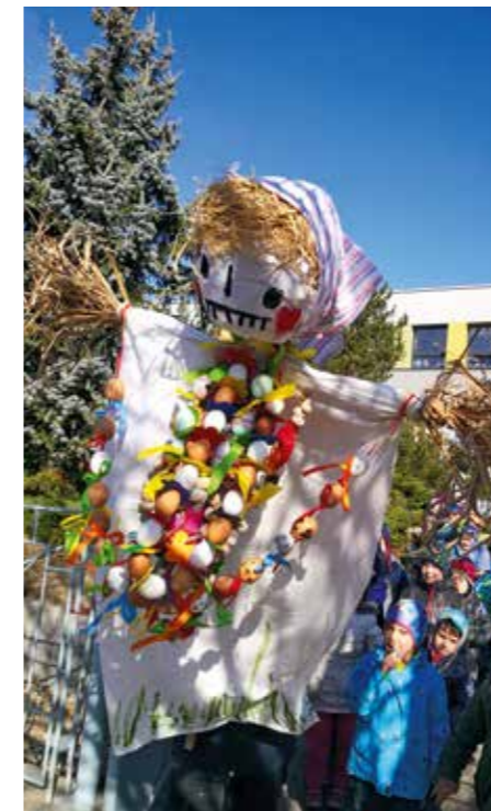
Zimo, zimo, táhni pryč nebo na tě vezmu bič