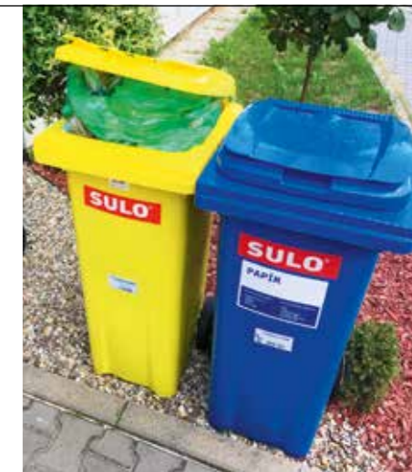
Nádoby na plast a papír mohou být umístěny přímo na vašem pozemku.

Novinkou tohoto systému je možnost vkládat k plastovým odpadům do