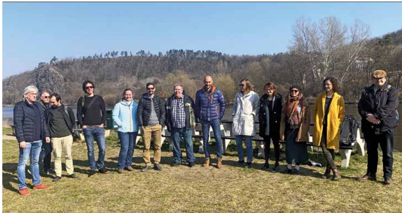
Jedním z diskutovaných témat je i vytvoření vodní plochy přímo v prostoru náplavky.