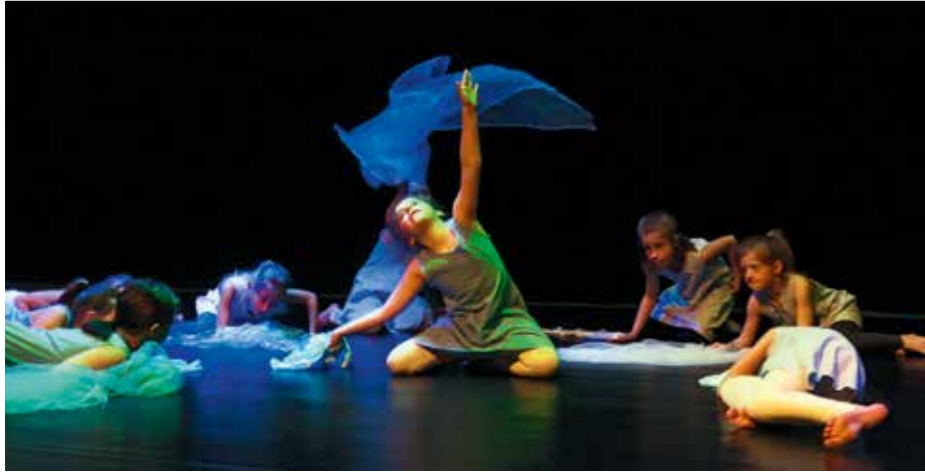
Obdiv si zaslouží všichni, neboť tancovali, jak nejlépe dokázali.