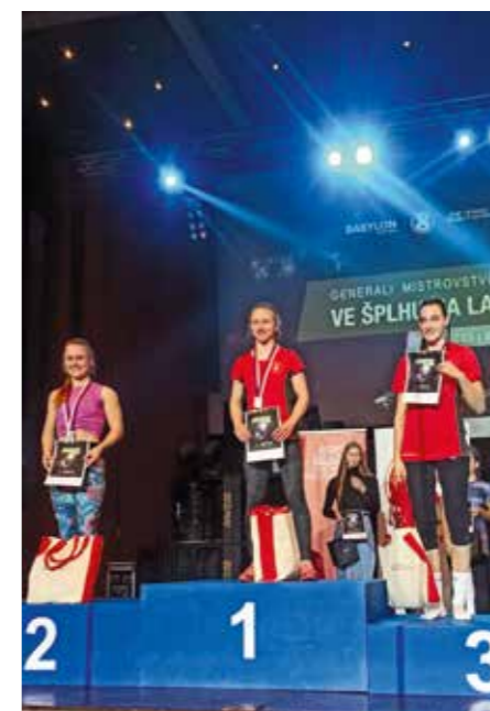
Tři nejrychlejší ženy

Jako další a poslední reprezentant Libčic v mužské kategorii jsem skončil na 6. místě, hned za reprezentantem