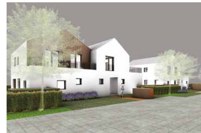
Přestože výsledná podoba domů v druhé etapě Parku Cihelka je zatím v rané fázi plánování, už nyní je jisté, že se bude jednat o viladomy.

Zájemcům o bydlení tu nabídneme bydlení v domech o maximálně třech bytových jednotkách, k tomu velkorysý veřejný prostor se