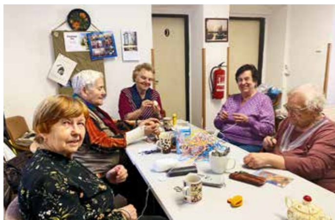
Výstava rukodělných prací ze soutěže Šikovné ruce našich seniorů proběhne 16.–19. 6. 2022