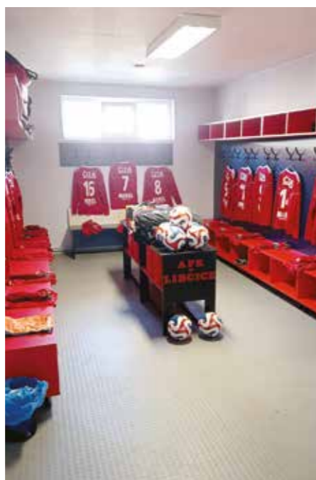
Fotbalové šatny s novým vybavením