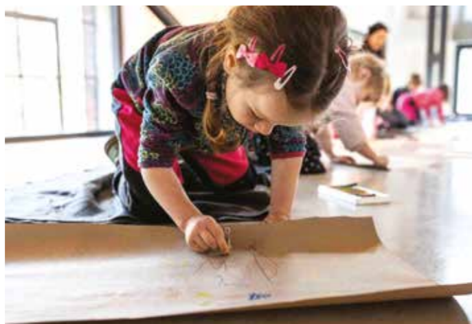
Wabi-sabi dílna pro děti 10. 5. od 16 hodin

So 10. 5. od 16.00 hodin Děti si projdou výstavu Ti, kteří raději kopřivy a seznámí se s tvorbou vystavujících umělků. V následné tvořivé dílně se budou inspirovat netradičními japonskými technikami. Zároveň se dotknou (spíše prakticky) i japonského pojmu wabi-sabi, který je zaměřen na přijetí krásy věcí v jejich pomíjivosti, nedokonalosti, jednoduchosti a v prožívání přítomného okamžiku.