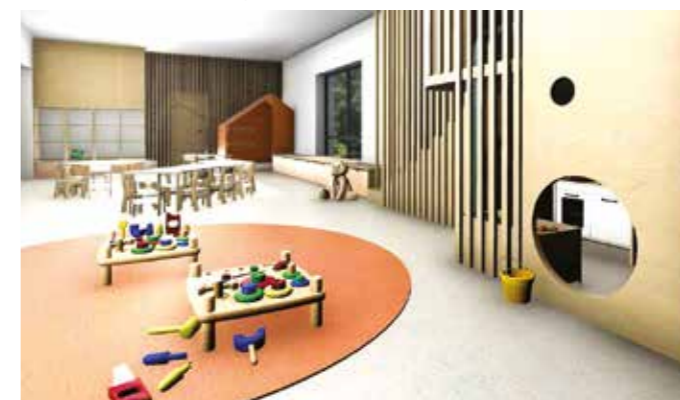
Interiér je tónován do přírodních barev s barevnými detaily.