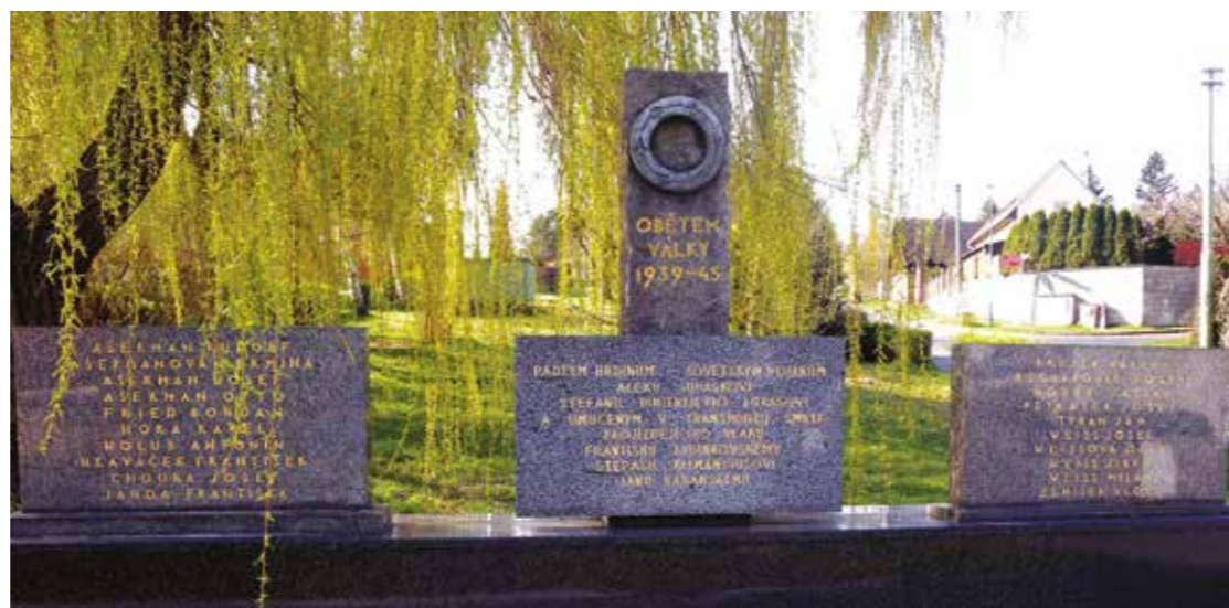
Pomník obětem války 1939-45 na náměstí Svobody

Nezapomeneme, a proto při této příležitosti společně vysadíme v parku na náměstí Svobody lípu.