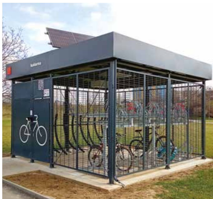
Kolárna u metra Opatov

Spolu s tím kraj podporuje i výstavbu zázemí pro přestupy mezi individuální a veřejnou dopravou. Do tohoto balíku opatření náleží nejen autobusové terminály u železnice nebo parkovací a odstavné plochy pro auta poblíž vlakových zastávek, ale také úschovny kol čili cykloboxy, kolárny a cyklověže. Tento typ zařízení