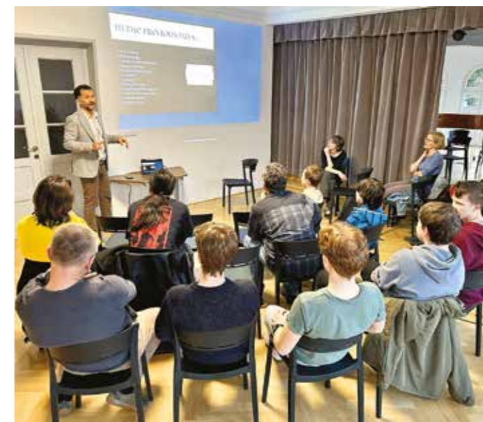
Nervozita zvedá adrenalin, což může být do určité míry prospěšné.