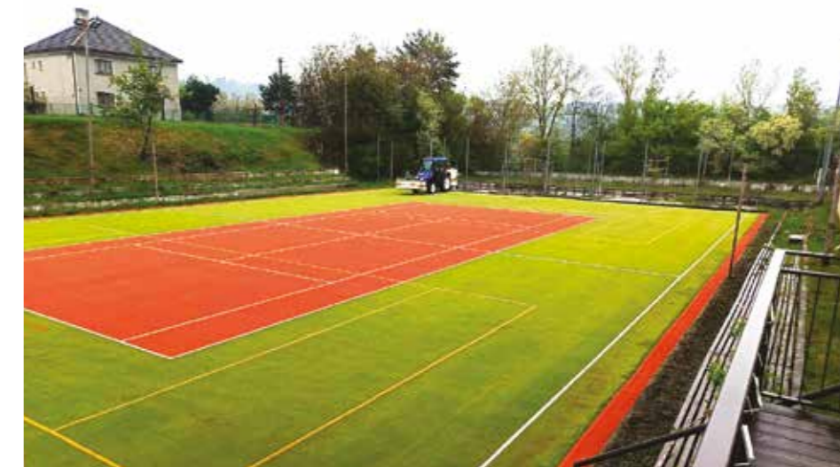
Rozdíl oproti původnímu stavu je nečekaný.

Aktuálně se také řeší vybavení libčické náplavky novým ohništěm nebo místem pro grilování. Stávající již dosloužilo a myslíme si, že tento prvek sem jednoznačně patří, a proto hledáme vhodné varianty a instalace bude následovat.