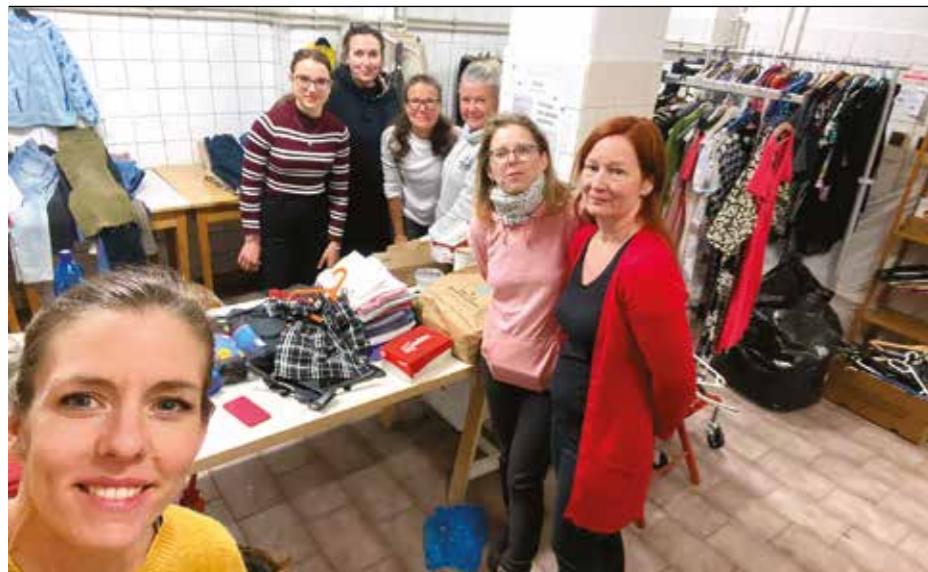
Největším úkolem je všechno náležitě roztřídit.