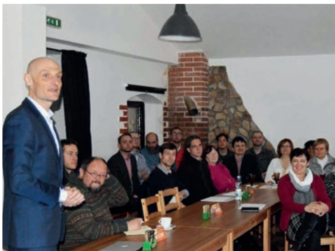
Z úvodního setkání na Plovárně - 5.3.2018

Koncem února jsme byli vedením města vybráni jako zpracovatelé urbanistické studie. Tento projekt navazuje na zhotovování strategického plánu pro město Libčice. V multidisciplinárním týmu se dlouhodobě zabýváme urbanismem menších měst a v každém projektu řešíme specifická zadání. Atraktivitu a jedinečnost Libčic spatřujeme v jeho nádherném přírodním rámci. Zachování kvalitního životního prostředí ve smyslu „obytné krajiny“ a hledání vztahu města k řece považujeme za klíčová témata. Významnou umělou bariérou je železniční koridor a průmyslová zóna v nivě řeky. Hledání nového využití a zároveň zpřístupnění průmyslového okrsku s navazujícími rekreačními prostranstvími jsou pro město velké výzvy. Vznik reprezentativního veřejného prostranství v centru města je diskutovaným tématem. Historický urbanistický vývoj jednotlivých částí i současná názorová diskuze ve městě mají komplikovaný vývoj. Rádi bychom podpořili snahy vedení města