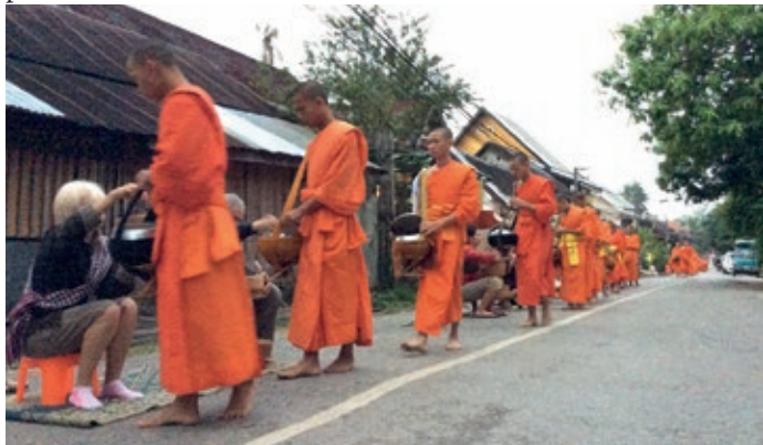
Darování rýže Luang Prabang.

Naši první zastávkou bylo bývalé hlavní královské město Luang Prabang. Tady jsme se stali aktivními účastníky místního rituálu. Za ranního rozbrusku jsme usedli na připravené stoličky a spolu s místními domorodci jsme každému procházejícímu mnichovi darovali malou hrstičku lepkavé rýže do jeho nádoby. Ten průvod trval asi půl hodiny a mnichů bylo nepočítaně.