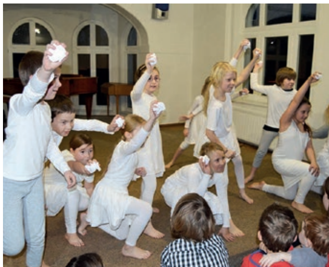
Co myslíte, hodili, či nehodili? K mému překvapení nehodili...