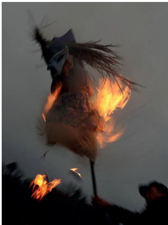
Kulšiči a tanečníci ze ZUŠ v pátek 16. března za doprovodu písní a tanců vynesli Moranu, čímž snad konečně zajistili příchod tolik očekávaného jara.