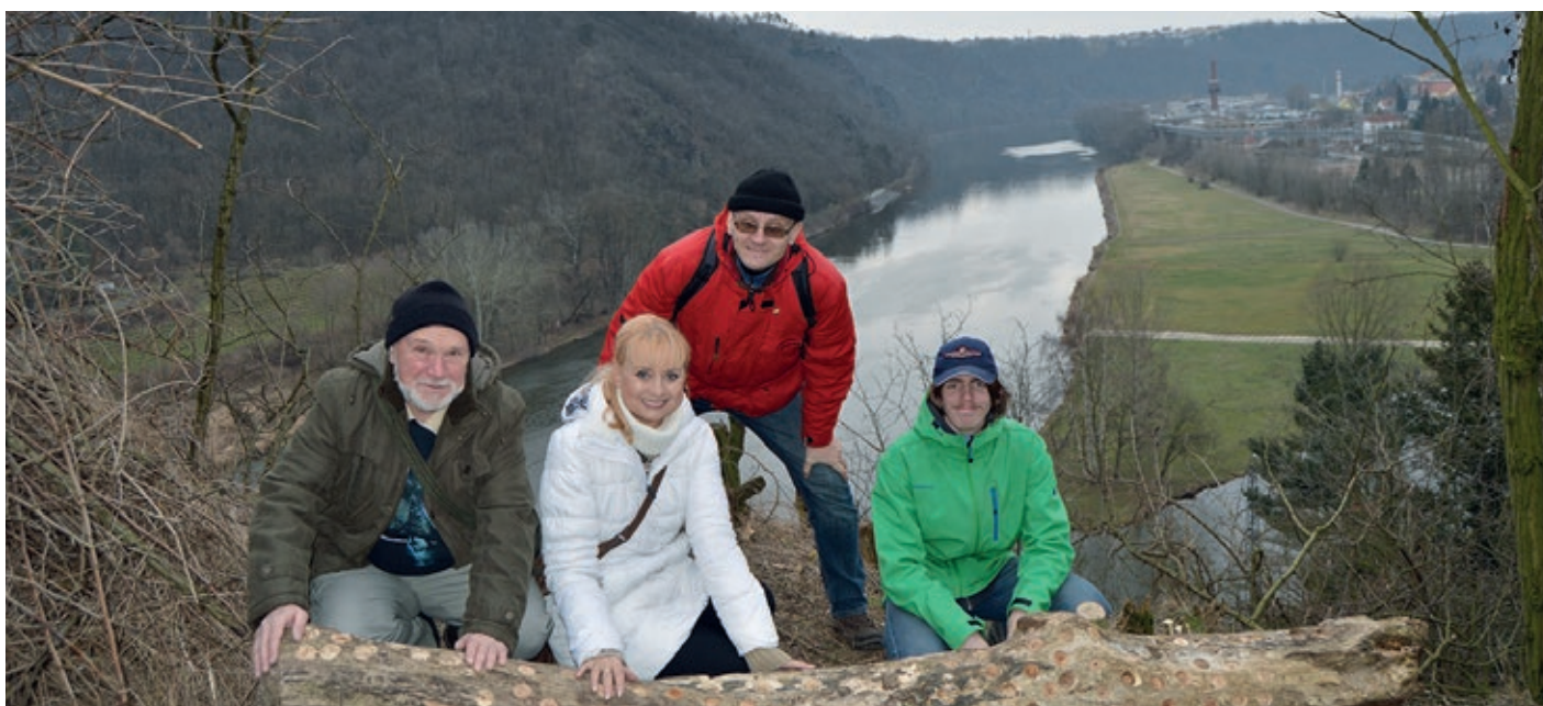
Pražští „kačeři“ mě vytáhli na Liběhrad, kde je třeba se na důkaz, že jsme tam byli, vyfotit u ČEWéGěčkovníku (kmen se zavrtanými logy „kačeru“ - hledačů kešek).