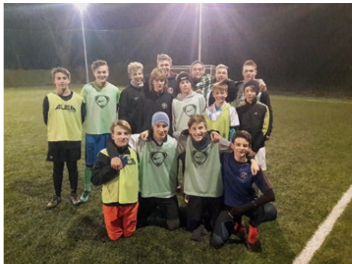
Jeden z mnoha zimních tréninků na umělé.