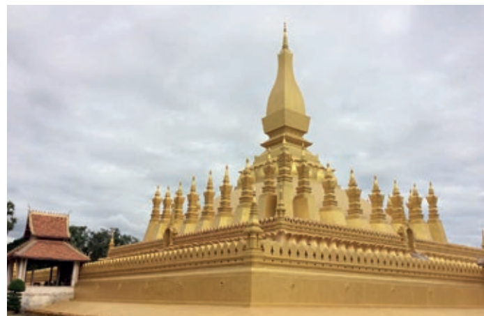
Velká stúpa ve Vientiane.

My jsme měli možnost jednu izolovanou vesnici navštívit, a tak trochu i poznat život v jejich prostředí. Jedná se o méně přizpůsobivé občany a laoská vláda pro ně má připraveny různé podpůrné programy, co se týká např. získávání základních hygienických návyků, vzdělávání apod. V severní části Laosu leží také současné hlavní město Vientiane, kde jsou k vidění bohatě zdobené buddhistické chrámy, muzea a další historické stavby, ve kterých bývá hodně soch a sošek Buddha, a také obrazů s výjevů Buddhova života od jeho narození až po jeho konec.