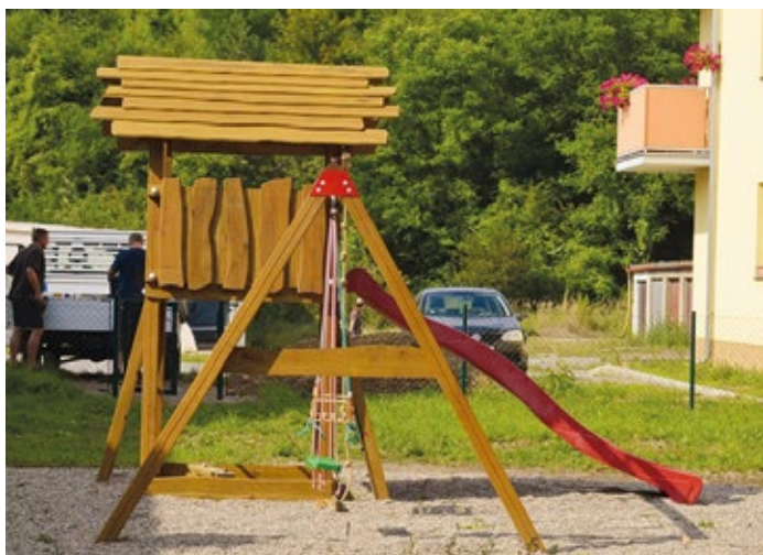
Dětské hřiště u domu za kulturním domem.