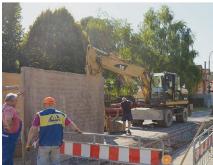
Kanalizace V Akátech.