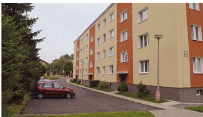
Stará Sahara - chodník a parkovací plocha.