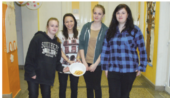
Víc hranolků nezbylo...