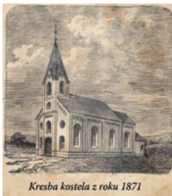
Kresba kostela z roku 1871