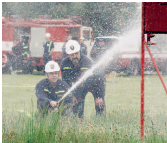
Více z Poháru starosty města na str. 10