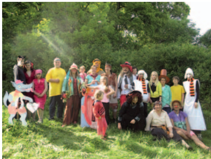
Pohádkový realizační tým