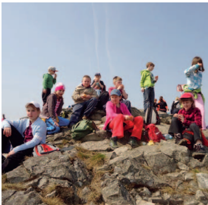
Ze školy v přírodě ve Svoru

Na začátku května jsme si s nadcházejícím hektickým finišem školního roku užili malé prázdniny v podobě