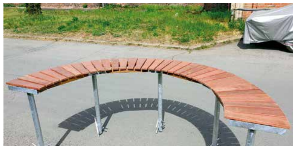
Konečným kompromisem jsou dvě půlkruhové lavičky.