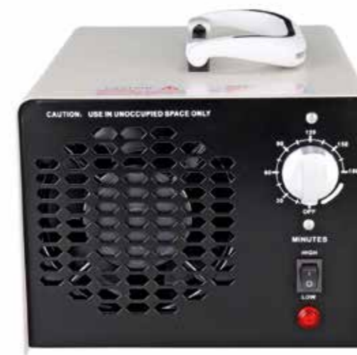
Výkonný vyvíječ ozonu.

velké prostory. Ozon působí v místnosti asi tři hodiny a ničí veškeré bakterie i viry bez následných chemických stop. Tímto způsobem budou dezinfikovány veřejné a sportovní prostory, obchody, lékařská zařízení a další možné objekty, kde dochází ke shromažďování veřejnosti. Dodávka prvního je přislíbena v druhé polovině dubna, druhého počátkem května.