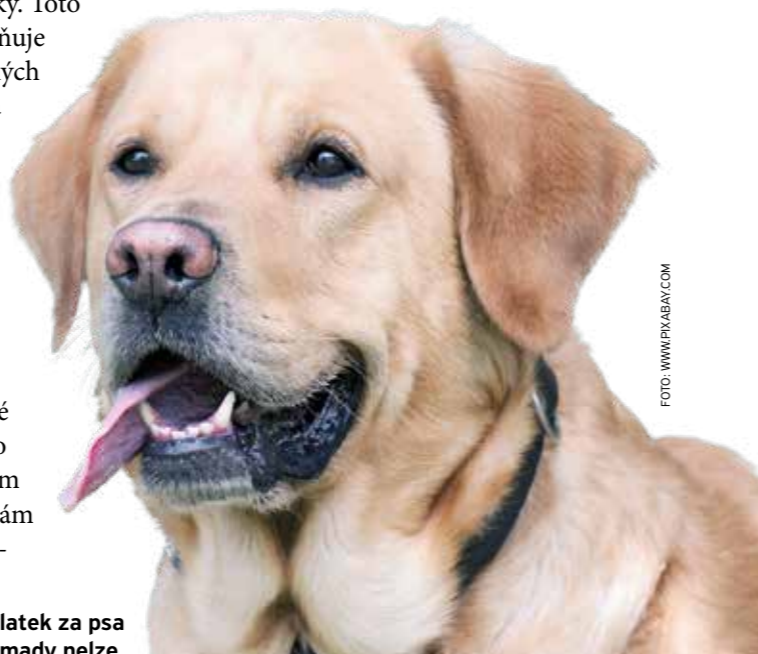
Zaplatit poplatek za psa a odpad dohromady nelze.