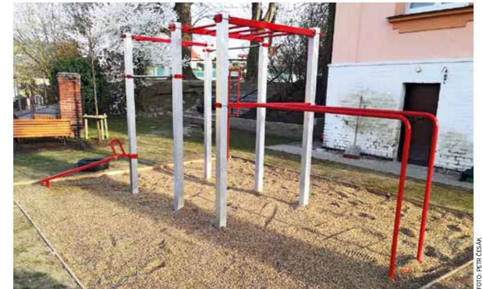
Nezahálejte a přijďte se protáhnout.

Pro kolo vám Libčice budou malé, proto se opřete do pedálů a zkuste vyrazit podél vody třeba proti proudu směrem