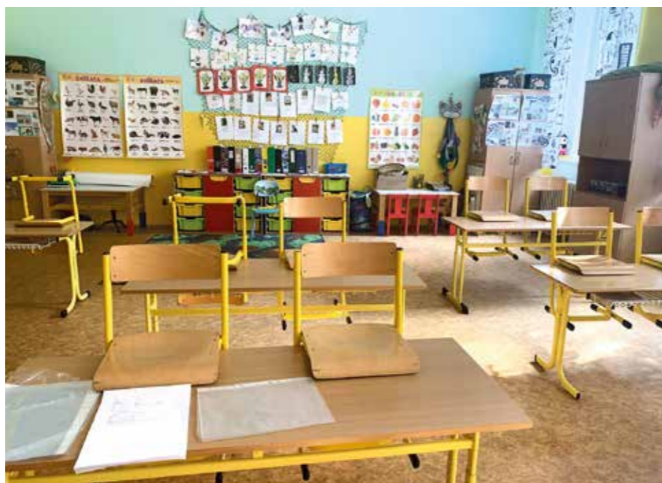
Školní třídy zejí prázdnotou.

Vyhlášení nouzového stavu a uzavření škol postavilo těmto snahám do cesty překážku. Prioritou se stala nutnost věnovat se nově vzniklé situaci. Hledat možná řešení zlepšení atmosféry ve škole jde pouze se zapojením pedagogů. Původně bylo naplánováno jednání školské rady a učitelů, které však nebylo