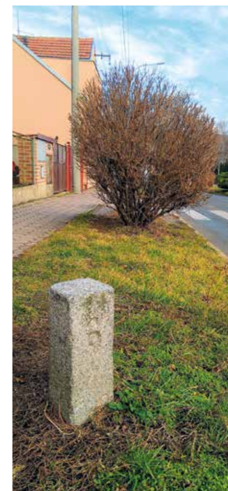
Patník hranice katastru Libčice – Chejnov.