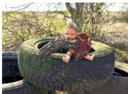
Odpad posbíraný v lese.

Na přelomu března a dubna se objevila výzva k improvizovanému úklidu města namísto covidem-19 zrušené tradiční akce Uklidme Česko. Zájemci, kteří se rozhodli mezi 2. a 5. dubnem v osamění uklidit nějakou část Libčic, si mohli na městském úřadě vyzvednout pytle a správa města výsledky jejich práce posléze odvezla. V rámci Libčického občanského spolku (LOS) moje žena Lucie vyzvala k úkli-