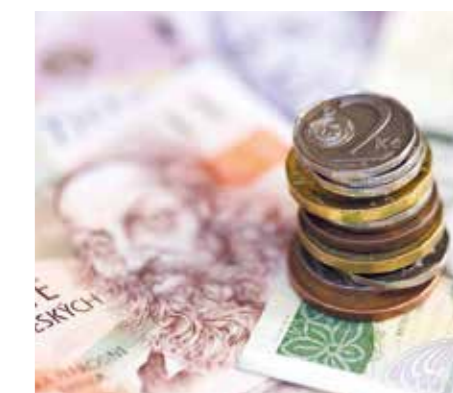
Celková hodnota investic je plánována na 22 mil. Kč.

V květnu bude probíhat výběr dodavatele na projekt zasíťování (voda, kanalizace, plyn) ulice Hašlerova. Jedná se o dlouhodobě plánovanou akci, která vychází z akčního plánu. Samotná realizace záměru bude finančně náročná, a tudíž závislá na získání dotace.