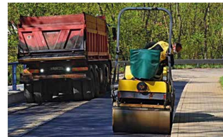
Dokončovací práce na silnici III/24017.

Finální práce proběhnou v dubnu, avšak opětovnému zahájení provozu musí předcházet nezbytná oficiální kolaudace za přítomnosti zadavatele.