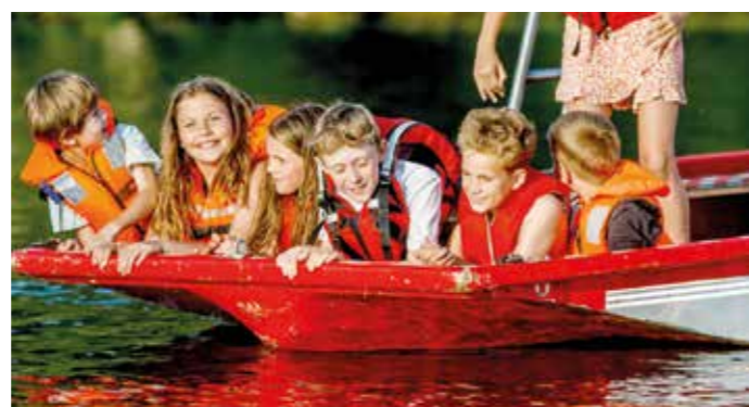
Den na řece milují především děti.

ličky-Libčice-Úholicke-Libčice, jste také vítáni. Nalodit se můžete v obou obcích. Na náplavce pro vás připravujeme odpoledne plné zábavy. Obří nafukovací kačeny a labuť se už těší na každoroční revizi a vyplutí na Vltavu. Dále na vás čekají sportovní hry, dílny, projíždky na člunu s hasiči, jóga s Majdou, 10 m dlouhý airtrack, odpočinková zóna, spousta dobrého jídla, pití. A nakonec přijde