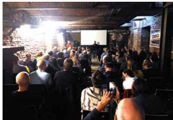
Na film i besedu praskalo kino ve švech.

Nevadí, tak jako odškodné divákům nabídneme omluvu a nápoj zdarma. Stalo se. Nálada výborná,