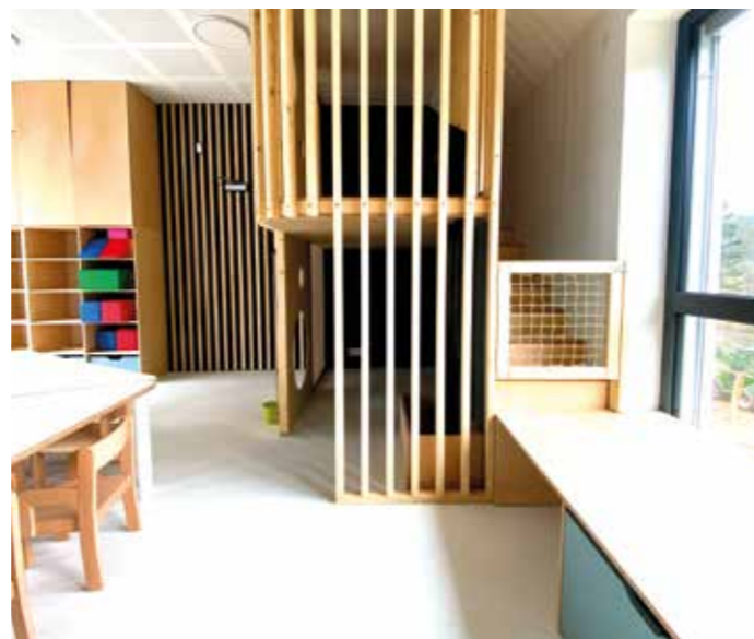
Novostavba pro dětské skupiny na Leteckém náměstí

Nová budova stojí v Letkách, v místě, které už řadu let čekalo na proměnu. Dětské skupiny jsou první vlastovkou a výsledkem spolupráce mezi městem a develope-