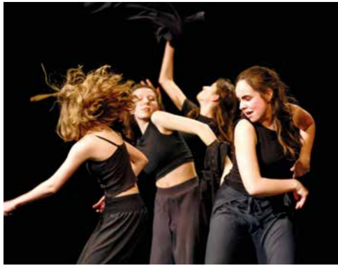
Taneční soubor ZUŠ Libčice

Jednotlivá představení ukazovala naše každodenní radosti i strasti života. V průběhu večera se tak na pódiu přehnal Aprilové počasí, které zatančil 2. a 3. ročník, viděli jsme padat hvězdy ztvárněné nejmladší skupinou, ponořili jsme se do těch nejpodivnějších snů v jedné z absolventských choreografií nebo se vrhli do ruchu velkoměsta díky nej-