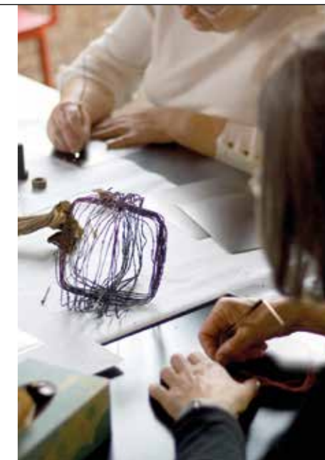
Ukázka ze společného tvoření

Srdečně zveme všechny, kdo si chtějí odpočinout, inspirovat se a strávit