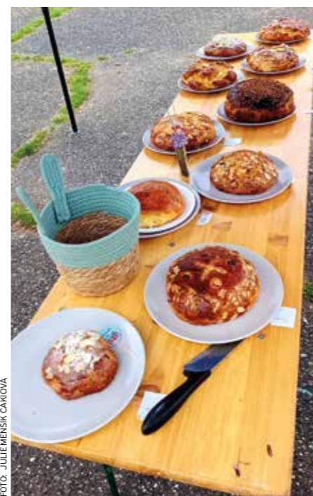
Soutěž o nejlepší mazanec

I v roce 2026 jsme uspořádali program, který obohatil oslavy Velikonoc v Libčicích. Jeho součástí byly i letos velikonoční workshopy. Kreativně se děti mohly zapojit také do společné výzdoby komunitní kraslice. Ta stála naproti libčické pekárně, kde si mohli zájemci vyzvednout prázdné kraslice k dotvoření. Těší nás, že se tato tradice ujala. Dle informací z pekárny se po vajíčkách ptali zájemci ještě dříve, než jsme komunitní kraslici připravili. Vajíčka k dozdobení pak zmizela přímo raketovou rychlostí. Už méně nás těší, že si někteří vezmou vajíčko, ale ozdobi