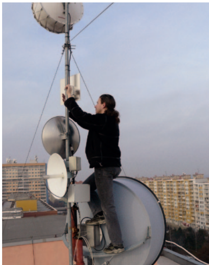
Občas provádíme až horolezecké práce.

Tak jo. Bylo to v době, kdy jediná rozumná možnost, jak se v Libčicích připojit k internetu, byla přes modem a vytáčené připojení. Kdo to používal ví, že to bylo pomalé a drahé. V té době už různě po republice, a hlavně v Praze, vznikala sdružení pod hlavičkou CZFree Net. Ta sdílela myšlenku komunitních sítí, postavených a spravovaných svépomocí svými členy. Tyto sítě jsou jednak propojené mezi sebou a jednak je možné připojit je k internetu. Díky tomu mají naši členové po celou dobu existence sdružení rychlejší, spolehlivější a levnější připojení k internetu než od komerční konkurence.