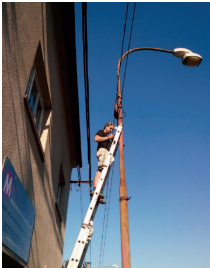
Připojování k optické síti.

Je to tedy tak, že připojení k internetu je dnes hlavním smyslem existence sdružení?