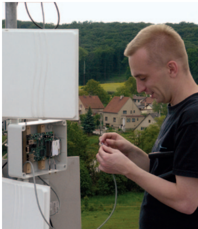
Pokrytí z výškových budov musí být všesměrové.

Chcete udělat něco nevšedního pro Libčice?