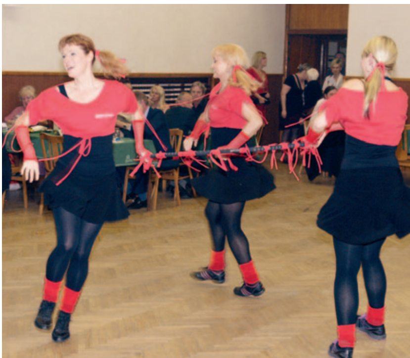
Fitforma v hasičských tričkách SDH Letky.

Fitforma předvedla zcela netradiční taneční vystoupení třech žen v jedné obruči na světoznámou melodii Toma Jonese „Sex Bomb“ a překvapením večera byla skupina Aurelius. Dva pánové obvykle prý předvádí ohnivou show, což v interiéru z důvodů bezpečnosti nešlo, proto místo plamenů zvolili lámací chemická světla, která bohužel nebyla v nedokonalé tmě v sále moc vidět. To ale nijak zvlášť nesnížilo zručnost, vynalézavost a originalitu jejich vystoupení. Napříště máme slíbené skutečné ohně – samozřejmě venku a pod dohledem zkušených hasičů z Letek.