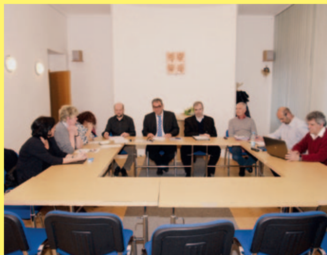
Zastupitelé Liběhradu poté, co opoziční opustili jednací místnost.