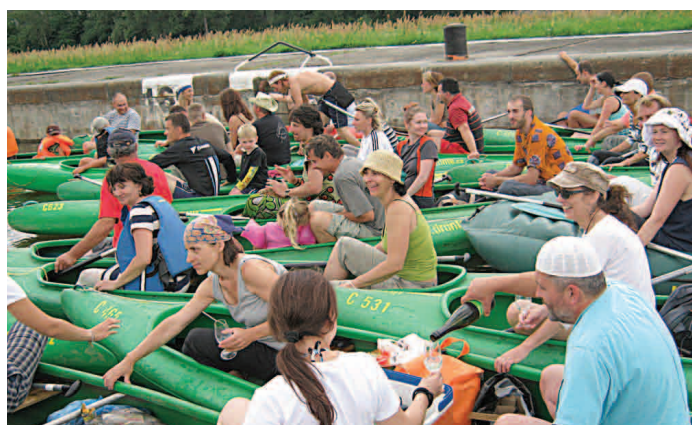
Poslední přípitek před startem

14. 7. 2012 ve 13 hodin se v Bohnicích nalodila spousta odvážných vodáků do 38 plavidel, mezi kterými převažovaly kánoe, ale vyplulo i několik plně obsazených šestimístných raftů, jeden všem sympatický vor s restaurací a nezbytná záchraná pramice se dvěma sestřičkami „Černého kříže“, které za sebou táhly záchranou nafukovací matraci. Naštěstí nebyla potřeba, neboť kdo se „cvaknul“ doplaval k břehu vlastními silami. Ano, i takoví byli.