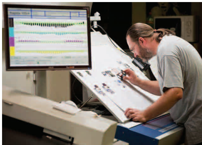
Z provozu tiskárny Libertas

Konkurz byl vyhlášen dne 20. 6. 2012, je zveřejněn na úřední desce města a na elektronické úřední desce www.libcice.cz . Příhlášky zašlete do 31. 8. 2012.