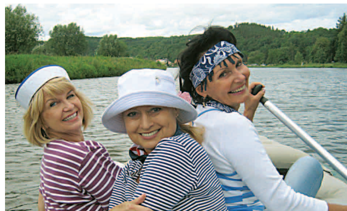
Ženská část posádky vítězného raftu „Libčický Vltavan“