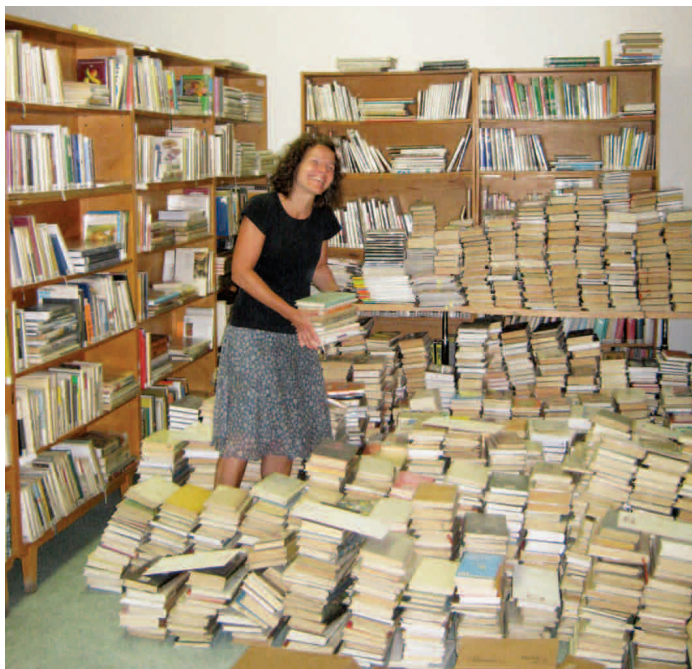
Knihovna bez regálů