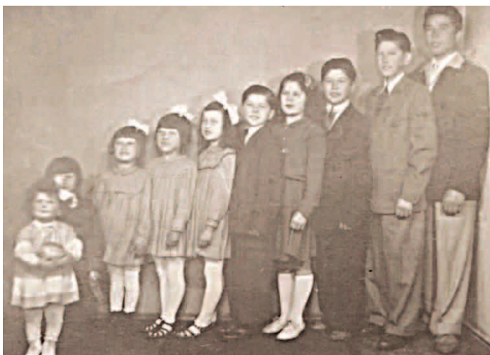
Deset Helferových sourozenců, ke kterým za čas přibylo ještě sedm

lidem je to jedno a nám v podstatě také. Naše obě rodiny jdou světem jako „kolotočáři“ již řadu generací, vyrostli jsme v tom, patříme k nim, a tak nás nějaké slovo nemůže rozházet.