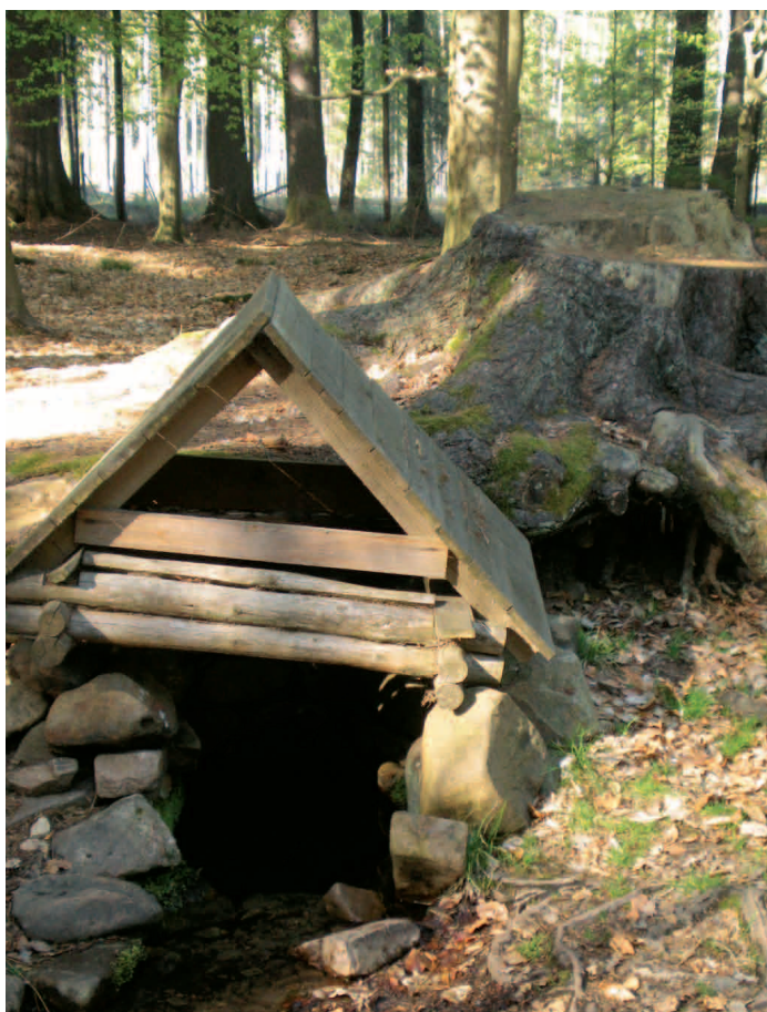
Voda a člověk

Děti mají prázdniny, ale naše soutěž pokračuje. Tentokrát uveřejňujeme nejzajímavější ukázky jejich prací, které vytvořily do červnového celoškolského projektu s názvem Voda, který doprovázely tři soutěže: Voda ve fotografii, Voda - jak ji vidím já, což byla výtvarná část, a Voda - coby volný literární útvar. Posuďte sami, jak se děti svého úkolu zhostily. Podle nás skvěle.