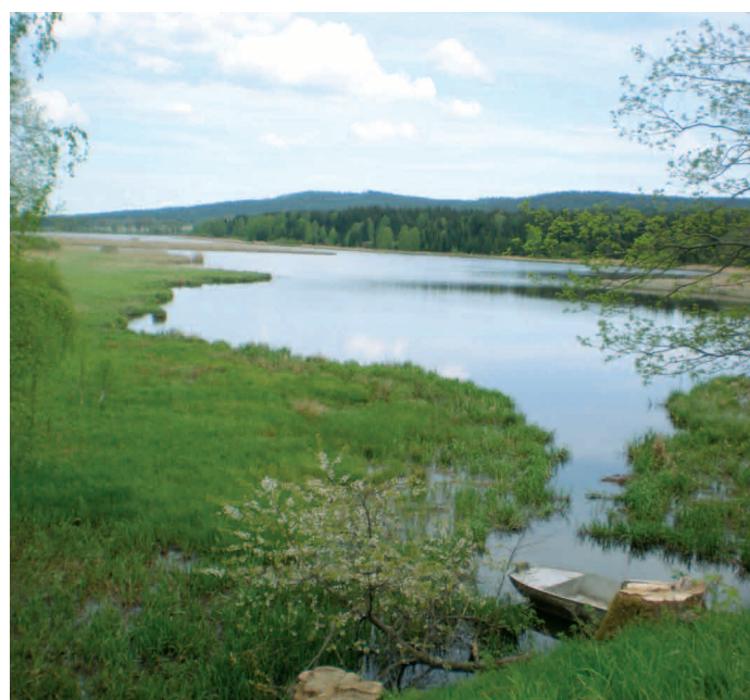
Voda v přírodě