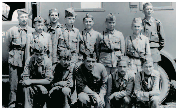
Vítězné krajského kola v soutěži družstev v Hořovicích v roce 1955